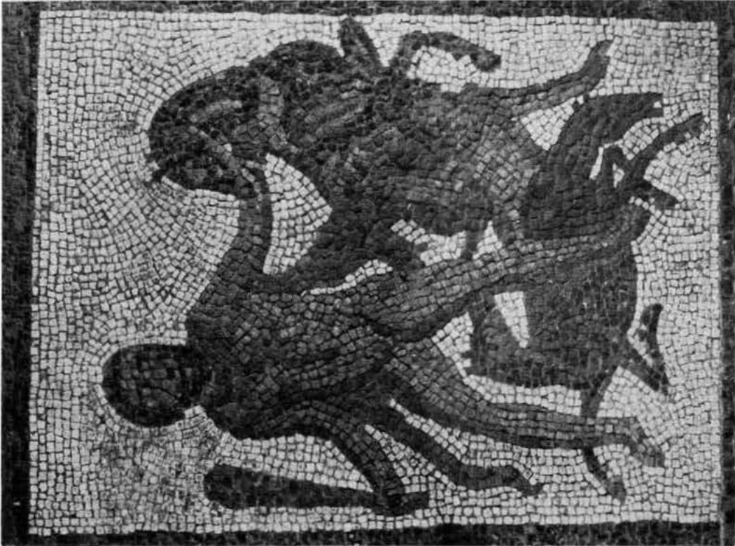
Hércules y las yeguas de Diomedes