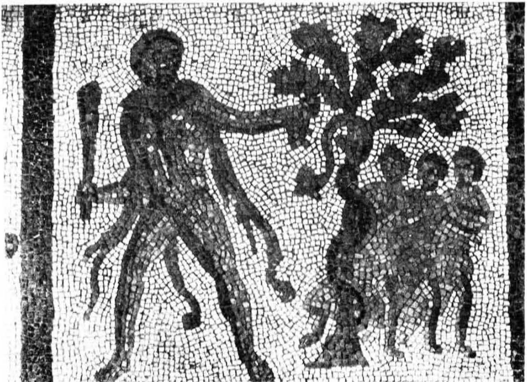
Hércules y el toro de Creta Hércules en el jardín de las Hespérides