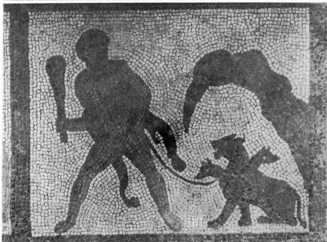
Hércules en los establos de Augias Hércules y Cerbero