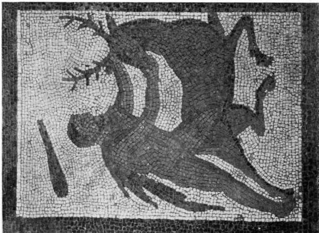
Hércules y la cierva de Cerínea