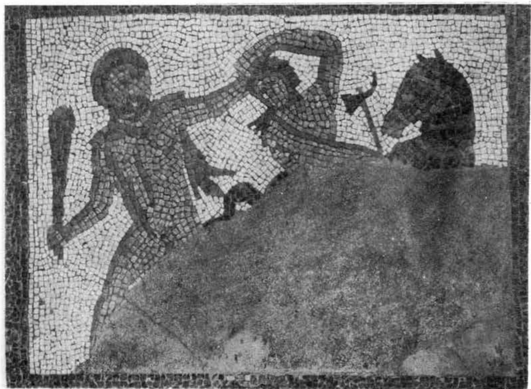
Hércules y el jabali Hércules e Hipólita