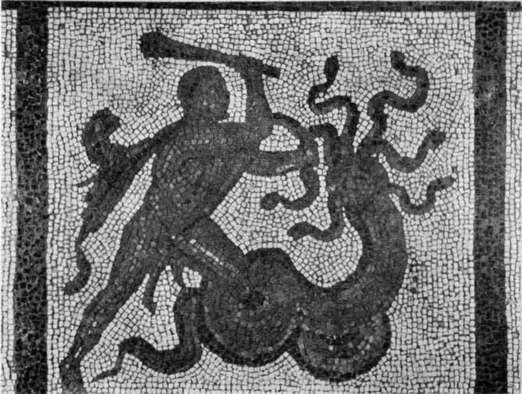
Hércules y el león de Nemea Hércules y la hidria de Lerna