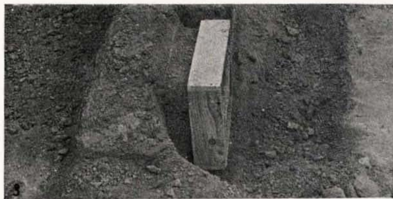
Diversas fases de la extracción de pinturas murales célticas