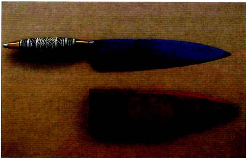
Cuchillo canario, España.

Fuera de España y siempre centrándonos en las armas cortas, en diferentes épocas, se fabricaron dagas de hoja ancha, como las conocidas dagas suizas, también conocidas como dagas holbein , del siglo XVI, de las cuales se efectuaron copias en la Alemania nazi, para los oficiales de los ejércitos del III Reich, así como para los de las SS.