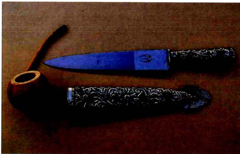
Facón, cuchillo gaucho, Argentina.

cazoleta; después darán paso a través del tiempo a los espadines europeos, siendo el precedente de los floretes modernos. En España existe una modalidad única destinada al toreo. Es una espada de morfología propia que la hace fácilmente reconocible. Es de hoja de doble filo muy delgada, se la conoce como estoque y tanto la empuñadura como la guarnición están forradas con cinta de lana tintada en