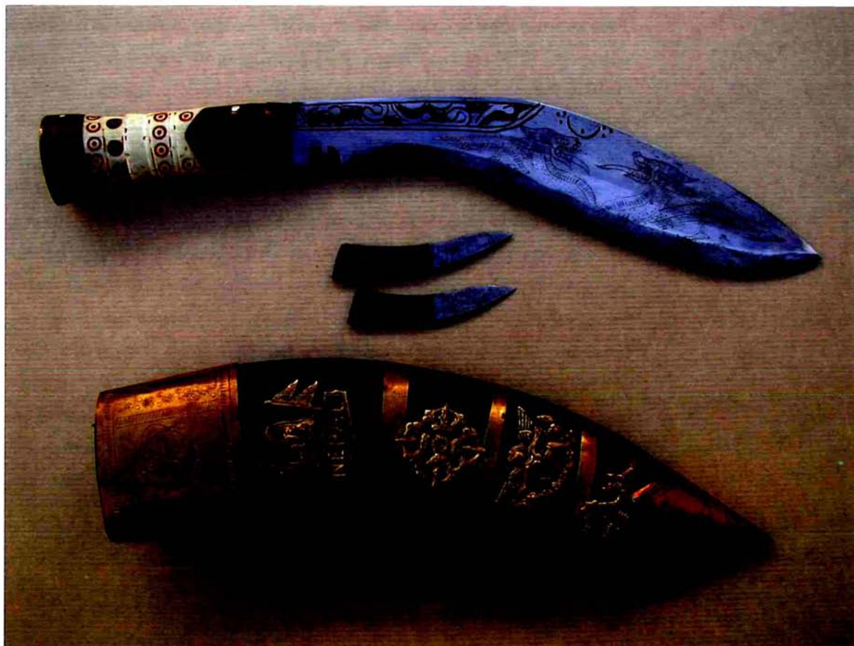
Kukri, cuchillo Gurka, Nepal.