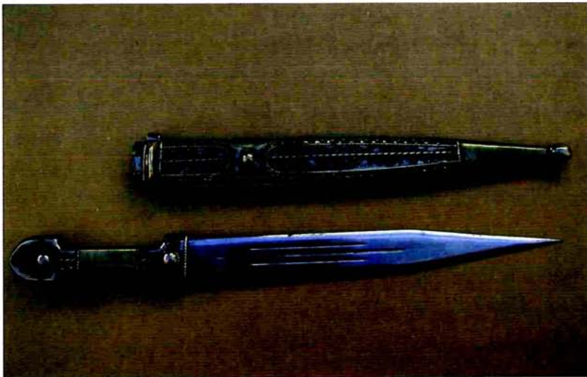
Kingdal, cuchillo del Cáucaso.

casos de ejemplares de gran lujo éste era de trenzado de plata.