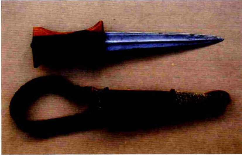
Cuchillo Nuba (Sudán), Telek.

En el Sudán y Chad, se utiliza una espada muy parecida a la takouba , que se conoce como kaskara . Suele presentar inscripciones árabes en la parte central del lomo de la hoja; el arriaz es rectilíneo, como el de las espadas medievales europeas, y podría ser que estuviese inspirado en las espadas de los cruzados. A diferencia de la espada tuareg, la empuñadura es circular y aplanada. La funda es de