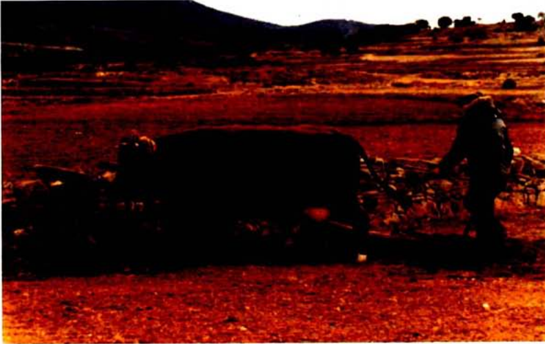
Labranza con bueyes y límite del campo. Alto Palancia. 1985. Museu de Prehistòria i de les Cultures de València.

caso y para un cultivo típico como es el de los cereales, se aprovecha el propio surco abierto por el arado. En el segundo, es menester cavar hoyos con distintos tipos de azada para instalar la planta o árbol que se requieren. Una vez realizado esto, la siguiente etapa importante es la del mantenimiento y cuidado del cultivo. En ésta se reconocen dos técnicas principales: la de entrecavar y la de podar. La primera más relacionada