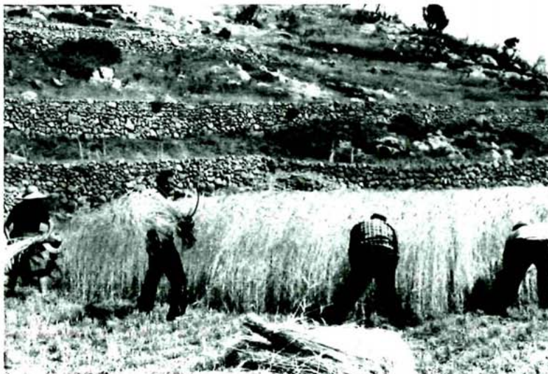
Segadores de cereal. L'Alcalatén. 1984. Museu de Prehistòria i de les Cultures de València.